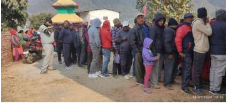
म्याग्दे गाउँपालिका, तनहुँको आयोजनामा मिर्गौला परिक्षण कार्यक्रम संचालन भएको छ।