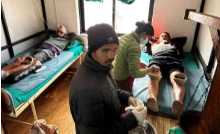
गण्डकी आयुर्वेद औषधालय, कास्की

अंक १७८, वर्ष ५, २०८० माघ २१, February 4, 2024 आइतबार